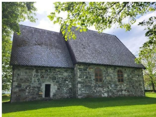
Logtun kirke.