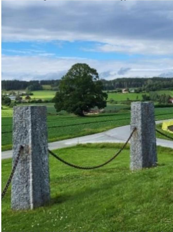
Kulturmiljøet Logtun og Frostatinget - 2018