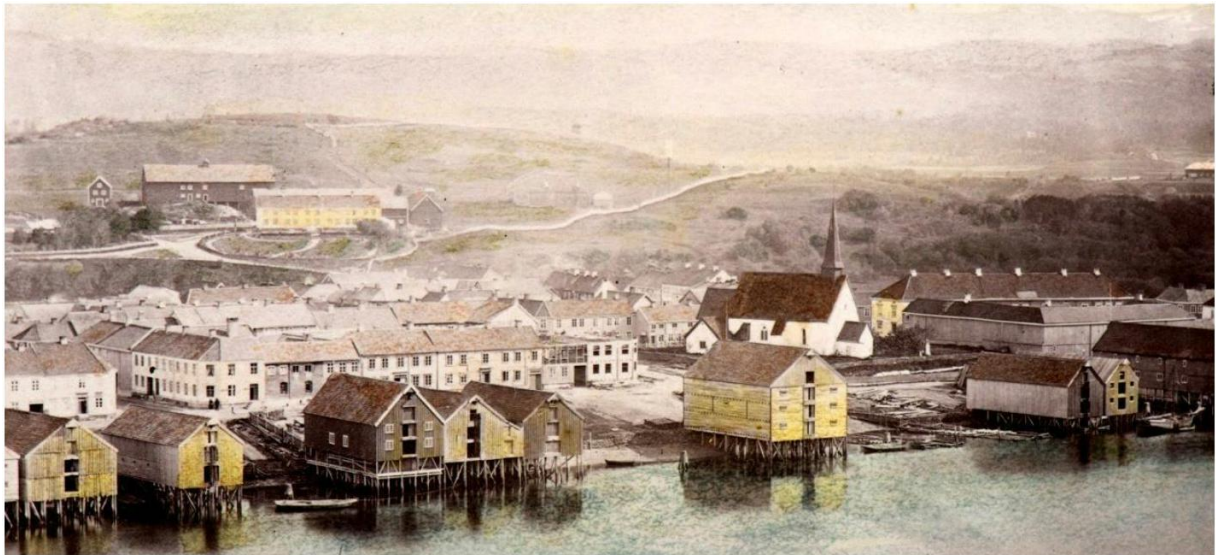
Levanger ca 1860

1100-1200: "Før og nå - bilder fra Levanger sentrum" v/ Liv S. Kjønstad og Hilde Løvås